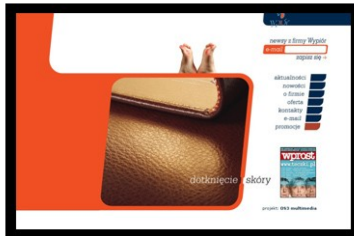
Widok strony głównej serwisu Teczki.pl

Posiadając w swojej ofercie między innymi skórzane teczki, firma „Wypiór” posiada alias www.teczki.pl .