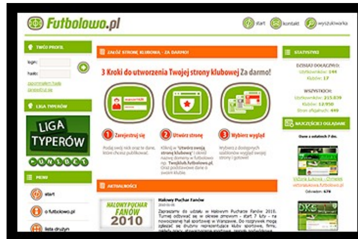
Widok strony głównej serwisu Futbolowo.pl

Serwis internetowy Futbolowo.pl napotkał barierę rozwoju w postaci wydajności bazy danych.